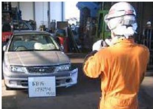
実績記録を補完する写真のイメージ

写真 に残すことで確実に 作動済み であることを 自ずと確認 する手順にしている事例。