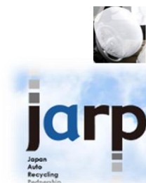
写真 に残すことで確実に 作動済み であることを 自ずと確認 する手順にしている事例。