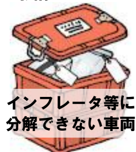
インフレーター等に 分解できない車両

※1 運転席用機械式エアバッグについては運搬時の衝撃による誤作動を防止する目的から、ボルトの空転等によりナットが外せない場合でも、ドリルやホールカッター等を使用して必ずインフレーターの状態にし、専用回収容器に収納してください。