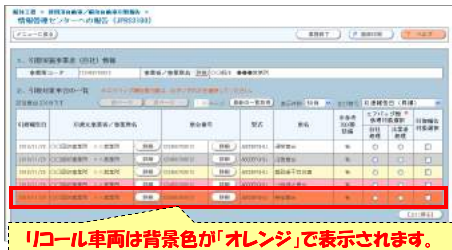
解体工程「1.1 使用済自動車/解体自動車の引取報告」画面

◇ 画面に表示されたリコール車両（背景色: オレンジ）は、既に改善された車両も存在しますので、車両に「改善処置実施済み」を示すステッカーが貼付されているかを実車にて確認してください。