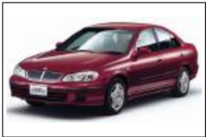
ブルーバードシルフィ