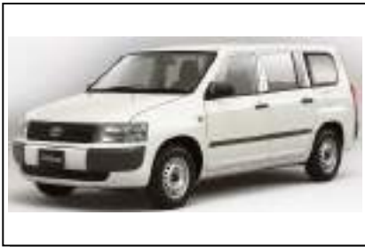
プロボックス/サクシード