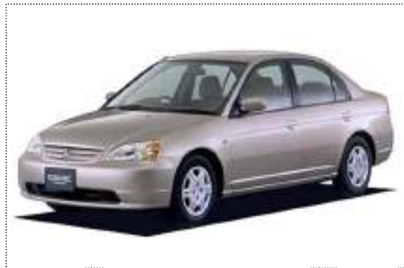
シビックフェリオ