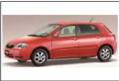
カローラ ランクス/アレックス