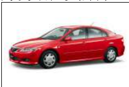
アテンザ スポーツ (5ドア)