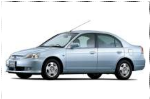
シビックハイブリッド