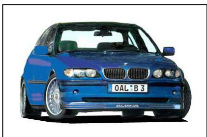
BMW アルピナ B3-3.3/B3S