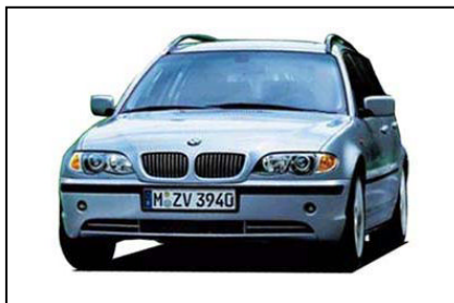
BMW 318i ツーリング