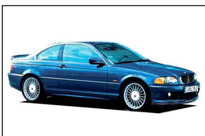
BMW アルピナ B3S クーペ