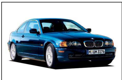
BMW 318Ci /330Ci