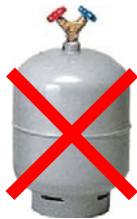
① ガードがついていない

※ 下記のボンベについては 別途対応が必要 となります。 該当ボンベを使用されていて、まだ自再協にご連絡いただいていない回収業者の皆さまは、 至急、自再協までご連絡ください。