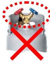
② ガードがバルブより低い位置についている