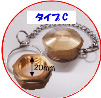
サイズ:口がね 20mm (おもにロケット型ポンペに使用)