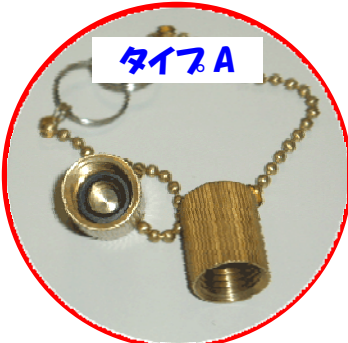
サイズ:ユニファイ 7/16-20