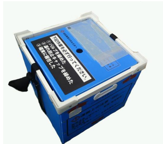
ボンベ専用ケース