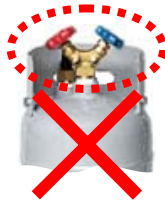
② ガードがバルブより低い位置についている