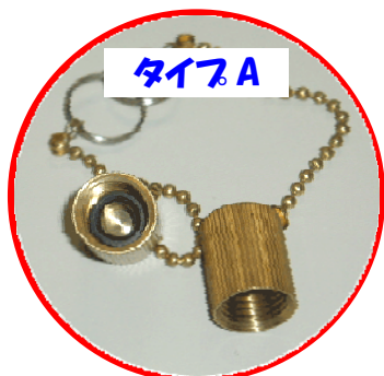
サイズ:ユニファイ 7/16-20

大型ポンペ用の漏れ防止キャップには、以下のタイプがあります。 お申込み時に選択してください。