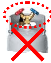
② ガードがバルブより低い位置についている