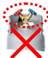
② ガードの位置が低い