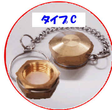
タイプC サイズ:口がね 20mm (おもにロケット型ポンペに使用)

大型ポンペを指定着払い方式でお引渡しいただく際は、先日ご案内させていただきました 下記 の注意事項にご留意いただくようお願い致します。