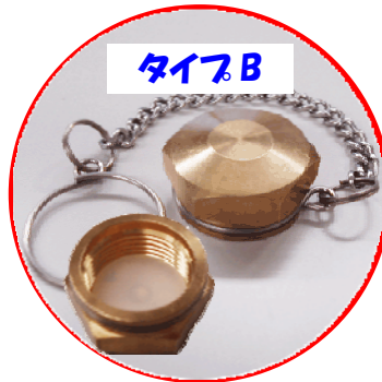
タイプB サイズ:口がね 26mm