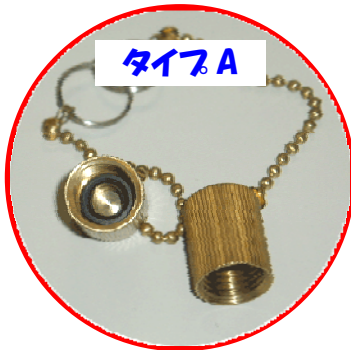
タイプA サイズ:ユニファイ 7/16-20

対象: 指定着払い方式で引き渡される大型ポンペ(10・12kgポンペ/20・24kgポンペ) 開始日: 2007年5月14日(月)以降に引き渡される大型ポンペ キャップのタイプ: 大型ポンペ用の漏れ防止キャップには、以下のタイプがあります。