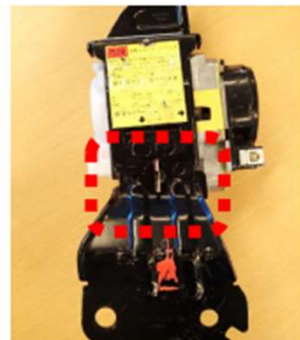
ピンが縦向きの状態

自動車再資源化協力機構（自再協） 業務部 TEL: 03-5405-6155 / E-mail: info@jarp.org