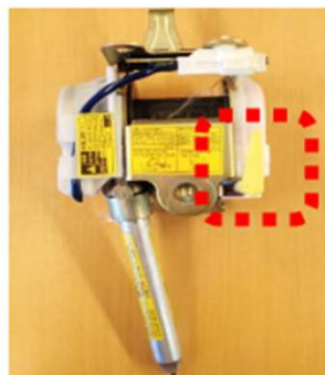
レバーが縦の状態